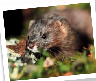
Vison d'Europe

Cet animal semi-aquatique est l'un des mammifères carnivores le plus menacé d'Europe. Difficile d'observation, son domaine vital s'étend sur plusieurs km de cours d'eau et de zones humides... Menacé par la destruction de son habitat, de collision routière ou de destruction